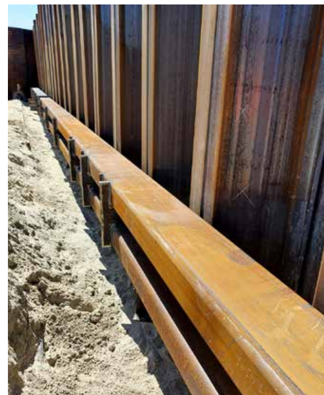
Metaalbewerkingsbedrijf Rijnberg is bevoegd om constructies conform NEN-EN 1090-2 uitvoeringsklasse 3 te realiseren.

'We zijn relatief klein in omvang, maar groot in de werken die we doen'